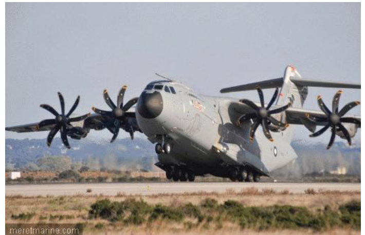
meretmarine.com L'A400M (© : AIRBUS MILITARY)

Depuis sa première édition en 1970, le meeting aérien de Cerny/LaFerté-Alais attire chaque année un nombre croissant de spectateurs. Au fil des ans, il s'est devenu l'événement incontournable et le plus prestigieux musée volant en Europe continentale. Cette manifestation est portée par l'Amicale Jean Baptiste Salis (AJBS), dont l'objectif est de préserver et de maintenir en état de vol des avions de collection, de valoriser le patrimoine aéronautique, de construire ou reconstruire des appareils appartenant à l'histoire de l'aviation, de transmettre les savoir-faire, de faciliter et de vulgariser la pratique de l'aviation tant par des moyens d'Etats que privés. L'Amicale compte aujourd'hui 300 membres dont une soixantaine très actifs qui oeuvrent en semaine et les week-ends, au maintien en état de vol de sa trentaine d'avions historiques. L'AJBS s'inscrit aussi dans le cadre du Musée Volant Salis, en exposant sa collection aux côtés des trois autres associations, Mémorial Flight, Les Casques de Cuir, Forteresses Toujours Volantes ainsi que celles des collectionneurs privés.