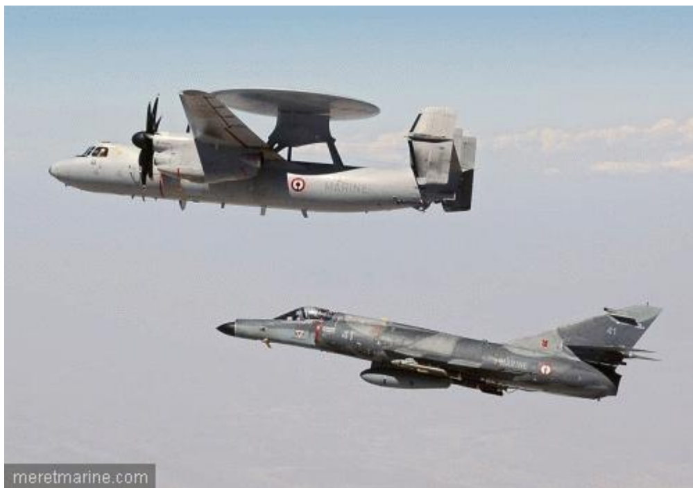
Un Hawkeye et un SEM de la Marine nationale