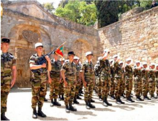
700 légionnaires en manœuvre à Fontfroide

Hier en tout début d'après midi près de 700 légionnaires du 4e REP (Régiment Étranger Parachutiste) de Castelnaudary, soit trois compagnies d'engagés volontaires, ont participé à des manœuvres militaires aux abords du massif avec des véhicules de commandement, de transports de troupe et des VAB (Véhicules avant blindés) entre autres. Ce rassemblement qui a lieu toutes les trois semaines à un mois