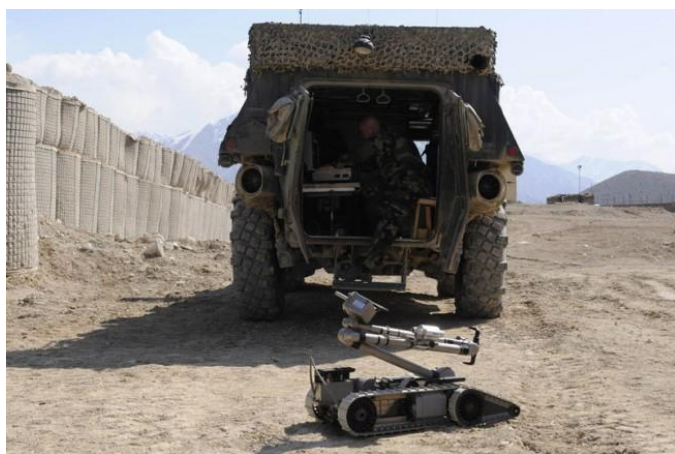
Le "Robot anti-IED" à l'oeuvre en Kapisa, Afghanistan (crédit : ministère français de la Défense/ DICOD, avril 2009)

Nicolas Gros-Verheyde / Capacités Milit – Exercices UE / mai 19, 2012