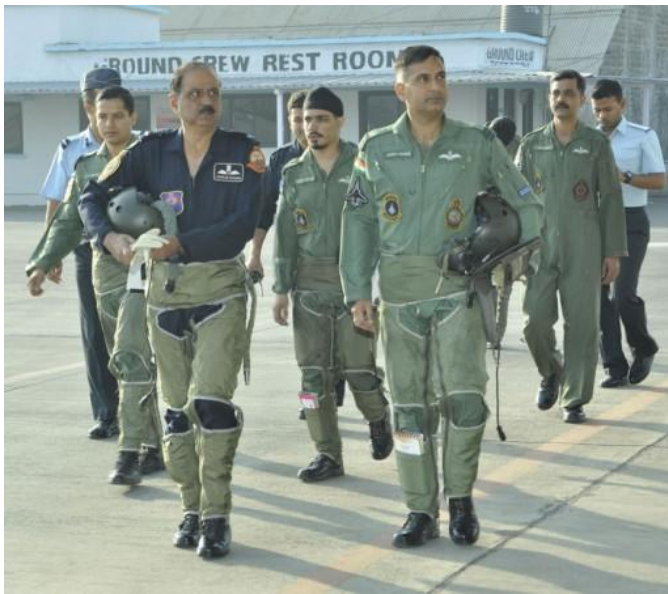
Le chef d'Etat-Major aérien lors d'une visite de l'escadron de Sukhoi 30 à la base aérienne de Pune en décembre 2011

(B2) Le chef d'Etat-Major des forces aériennes indiennes, Norman Anil Kumar Browne, est en visite en France, annonce son secrétariat. Une visite « importante » signale-t-on à New Delhi, « c'est la première visite officielle de haut niveau de l'Inde en France après la mise en place du nouveau gouvernement français ». Objectif :