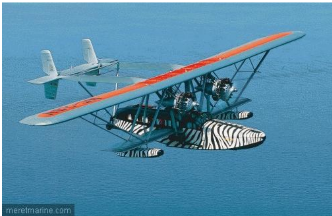
meretmarine.com Sikorsky S-38 (© : XAVIER MEAL)