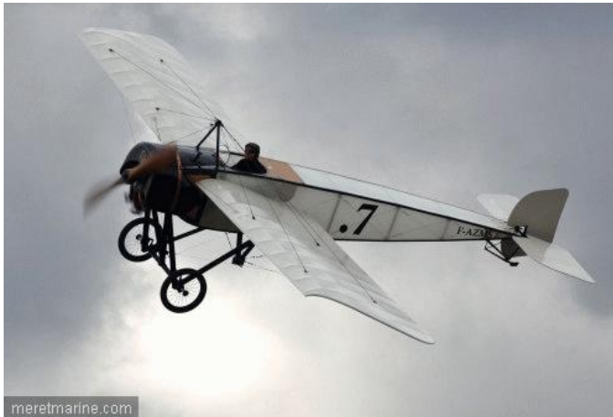
Morane H