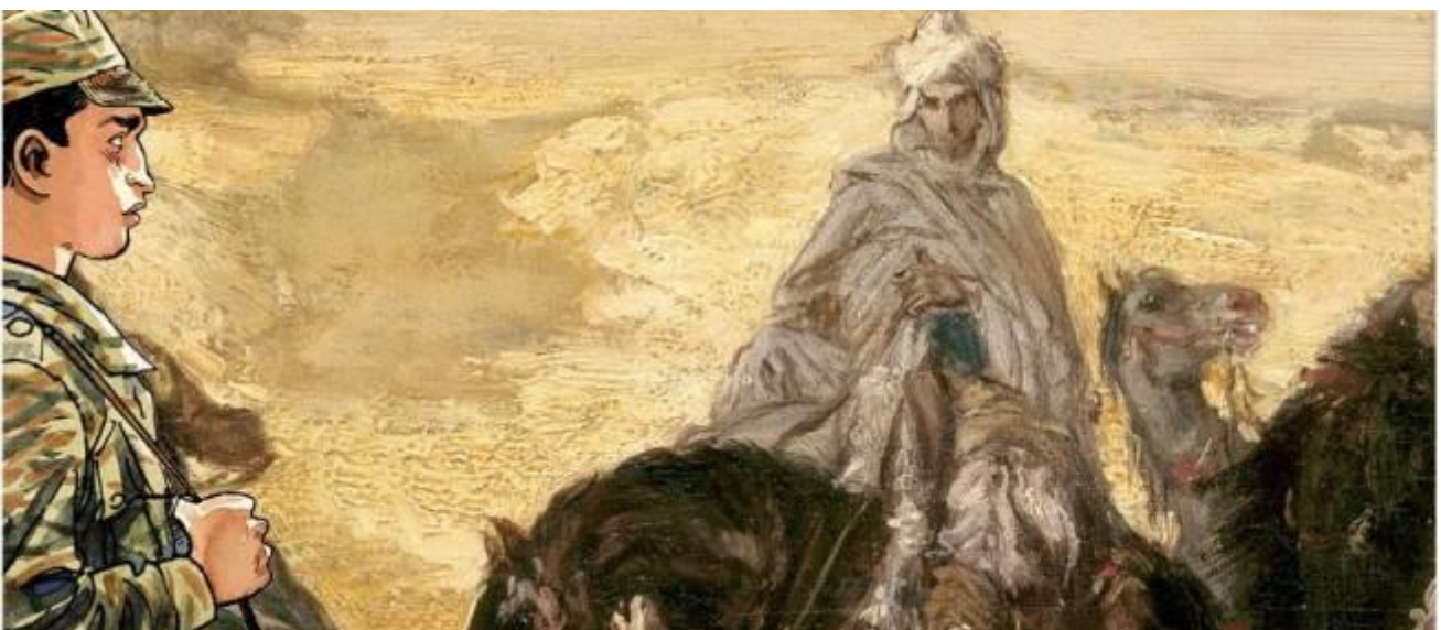
Le musée de l'Armée présente l'exposition "Algérie, 1830-1962".

Le musée de l'Armée propose une étonnante exposition sur l'histoire complexe de la relation entre la France et l'Algérie.