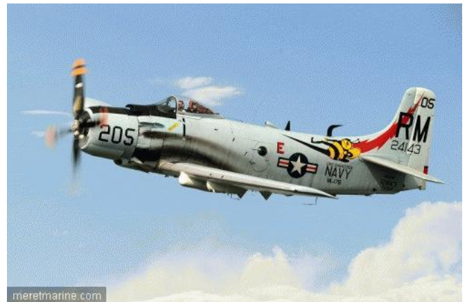
meretmarine.com Skyraider (© : HARALD LUDWIG)