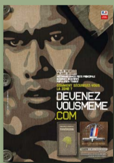
Recrutement de l'armée de Terre